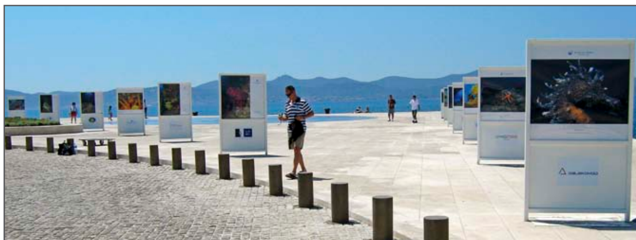
Zadar: 16. - 23. 07. 2010. - Riva