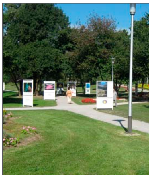
Zagreb: 27.08. - 10.09. 2010.- Bundek