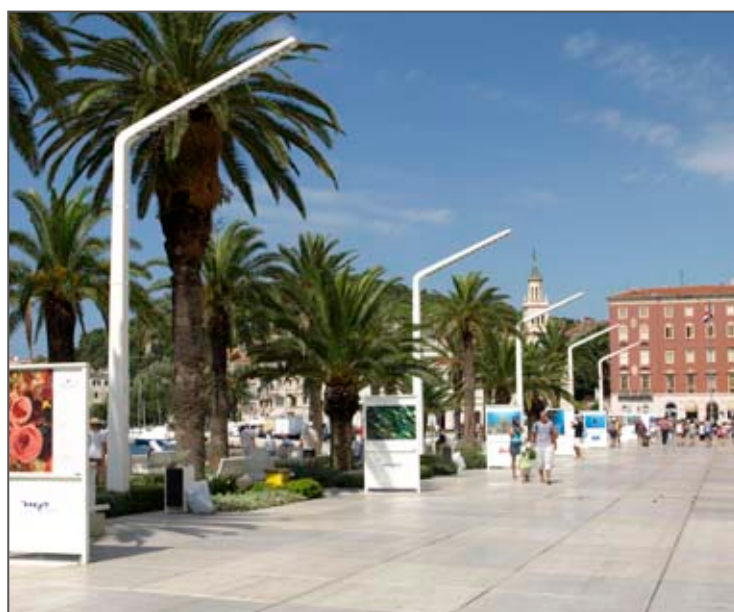
Split: 30. 07. - 6. 08. 2010. - Riva