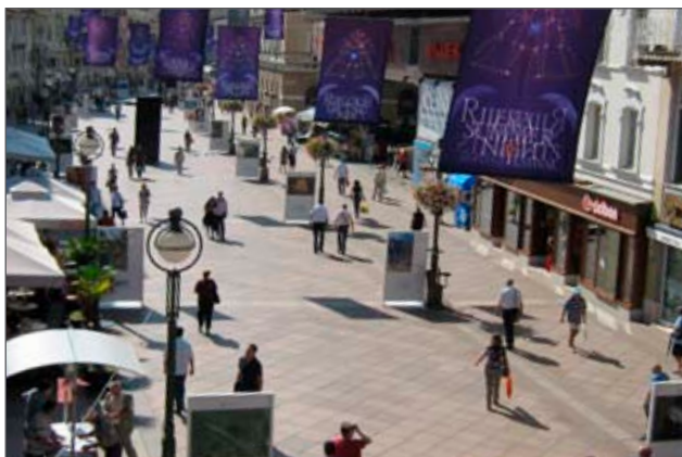
Rijeka: 18. - 25. 06. 2010. - Korzo