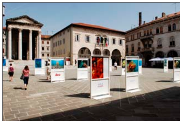
Pula: 11. - 18. 06. 2010. - Forum